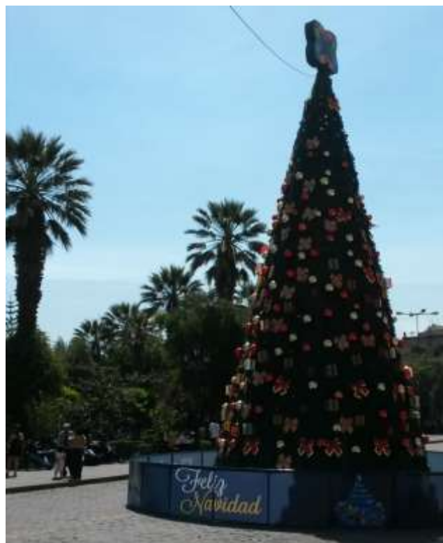
Weihnachtsbaum an der Plaza de Armas in Arequipa

Dass wir tatsaechlich schon in der Adventszeit angekommen sind, kann ich gar nicht glauben. Das liegt einerseits an der Hitze und dem Sommer, die mein Zeitgefuehl voellig durcheinander bringen und andererseits kann ich einfach nicht fassen, dass das Jahr 2014 schon zur Neige geht! Das einzige, was mich daran erinnert, sind die Weihnachtsgruesse, die wir an die Partnerschaftsgemeinde nach Oberried geschickt haben, der Adventskalender mit Gedichten, Bildern un Weihnachtsgeschichten, den ich fuer die Kinder gemacht habe, sowie die weihnachtliche Dekoration, die wir sowohl hier in der Albergue, als auch in Arequipa und Lima haben.