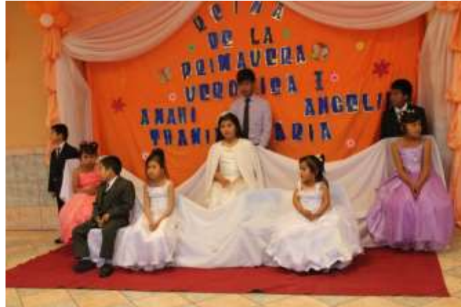
Die Fruhlingshoheiten jedr Altersgruppe

Ueberhaupt gehen hier oft Kleider- und Spielzeugspenden ein. Diese versuchen wir dann immer gerecht auf alle zu verteilen, wobei dann oft auch Neid und Streit aufkommt, da sich manche benachteiligt fuehlen und andere nicht teilen wollen. Ich habe hierbei festgestellt, dass die Jungs wider meines Erwartens deutlich schlimmer waren als die Maedels.