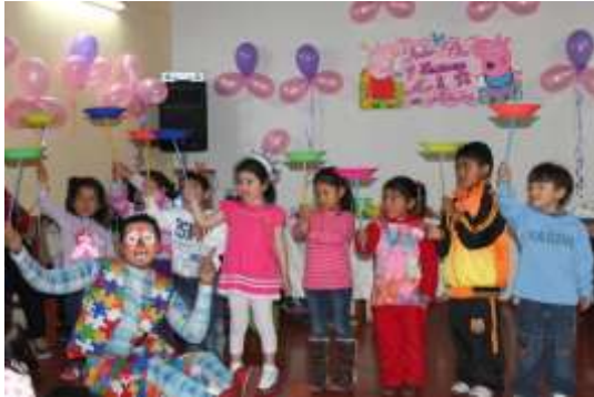
Der Clown mit den Kindern

Mexiko geben wuerde. Da habe ich mich wohl geirrt... Diese wird dann aufgerissen und die Kinder stuermen los, um Suessigkeiten und kleine Spielsachen zu ergattern. Am Ende werden dann noch Torte und Tuetchen mit allerlei Suesskram verteilt und alle sind happy!