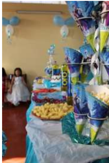
Der Geburtstagstisch mit haufenweise Suessigkeiten

Aber auch an anderen Festen mangelt es hier nicht. So haben wir Mitte Oktober ein Fruehlingsfest gefeiert, fuer das aus jeder Altersgruppe ein Koenigspaar des Fruehlings gewaehlt wurde, welche dann sehr schoen und aufwendig gekleidet auf ihrem koeniglichen Thron sassen. Den Essenssaal haben wir Betreuerinnen dann aufwendig geschmueckt und das vielseitige Programm konnte losgehen. Als kroenender Abschluss haben alle, die im letzten Schultrimester besonders gute Noten hatten, ein kleines Geschenk bekommen, welche von ausserhalb grosszuegig gespendet wurden.