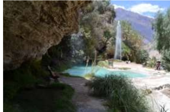
Thermalbad bei Churín

Meine Freizeit, die ich in Mollendo habe, verbringe ich hauptsaechlich mit dem Gitarre spielen ( ich habe mir jetzt als Andenken sogar eine eigene Gitarre gekauft) und jungen Leuten aus der Gemeinde, die sehr oft bei uns zu Besuch sind. Mit manchen von ihnen habe ich mich schon ziemlich gut angefreundet. Sonntags backen wir dann meistens zusammen Broetchen oder wie jetzt um die Weihnachtszeit Keckse, essen gemeinsam zu Mittag und quatschen ganz viel. Dass sie alle ein ganzes Stueck aelter als ich sind, macht dabei gar nichts. In meinem Alter kenne ich nach wie vor leider nur sehr wenige Jugendliche aber vielleicht aendert sich das noch.