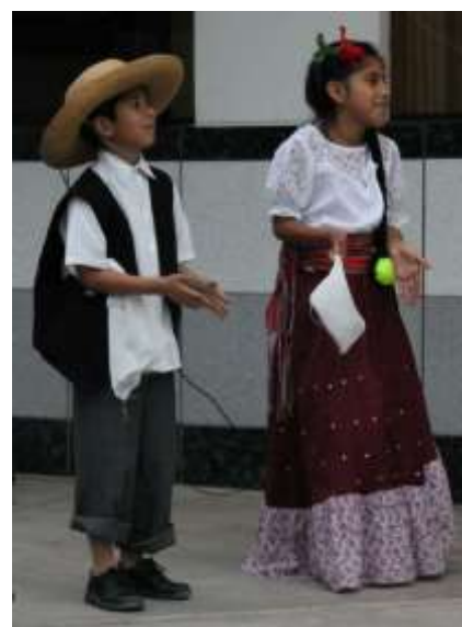
Kinder fuehren einen landestypischen Tanz vor