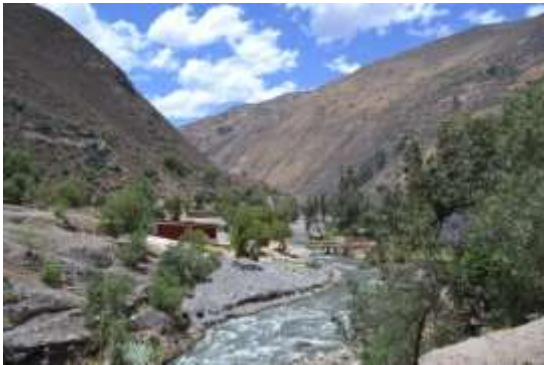
Die schoenen Anden

ein solches gegangen, anschliessend haben wir gemeinsam mit den Kindern der Albergue zu mittag gegessen und danach hatten wir ein zweistuediges buntes Spieleprogramm vorbereitet, was sehr gut ankam und auch sehr lustig war!