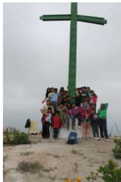
Endlich angekommen am Kreuz, die ganze stolze Gruppe